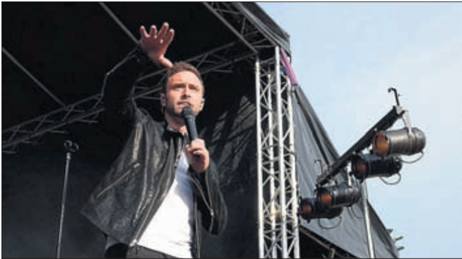
Dragplåstret vid Norrvalla kan nog stavas Måns Zelmerlöw. Eurovisionsvinnaren uppträdde med såväl egna hits som tolkningar av gamla bekanta svenska visor.