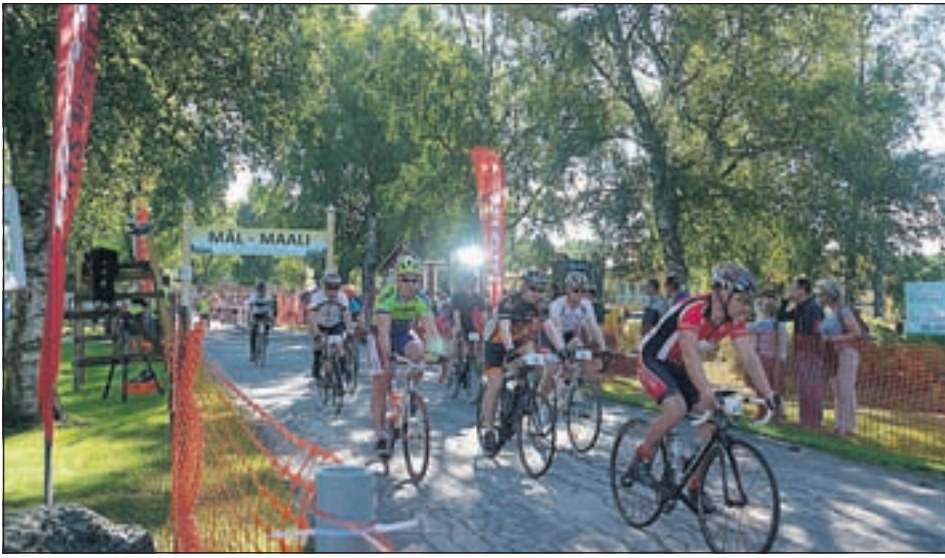
Lördagen den 25 juli gick startskottet för Botniacyklingen 2016. I årets lopp deltog sammanlagt drygt 1000 cyklister