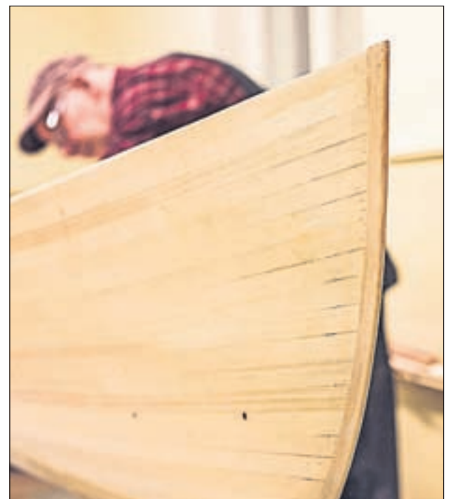
På medborgarinstitutets kurs har den som är intresserad av att bygga sin egen kanot möjligheten att göra det

Kom ihåg att alla kurser kräver förhandsanmälan och läsårskurser gäller för både höst och vårterminen, men kursavgiften är uppdelad på 2 fakturor. Ifall du avbryter en kurs och inte tänker fortsätta på våren, så