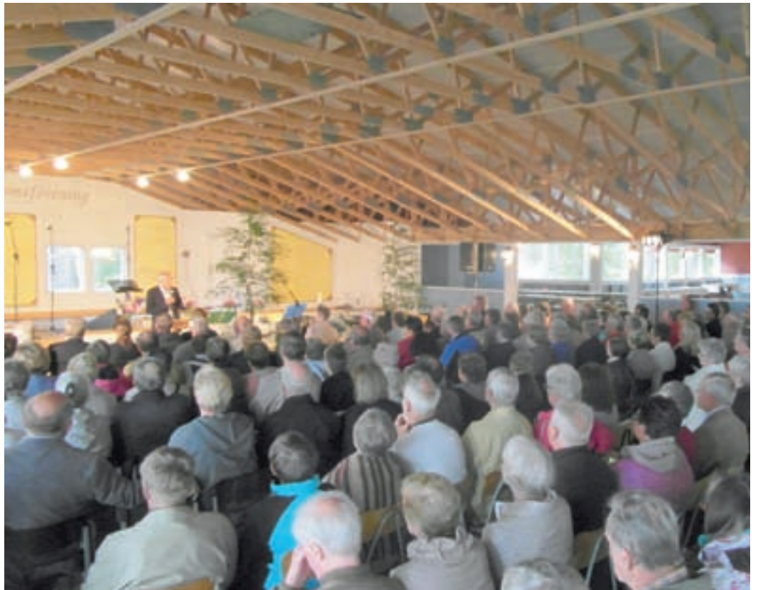
Sommarmötena försiggick i huvudsak på dansbanan i Maxmo.