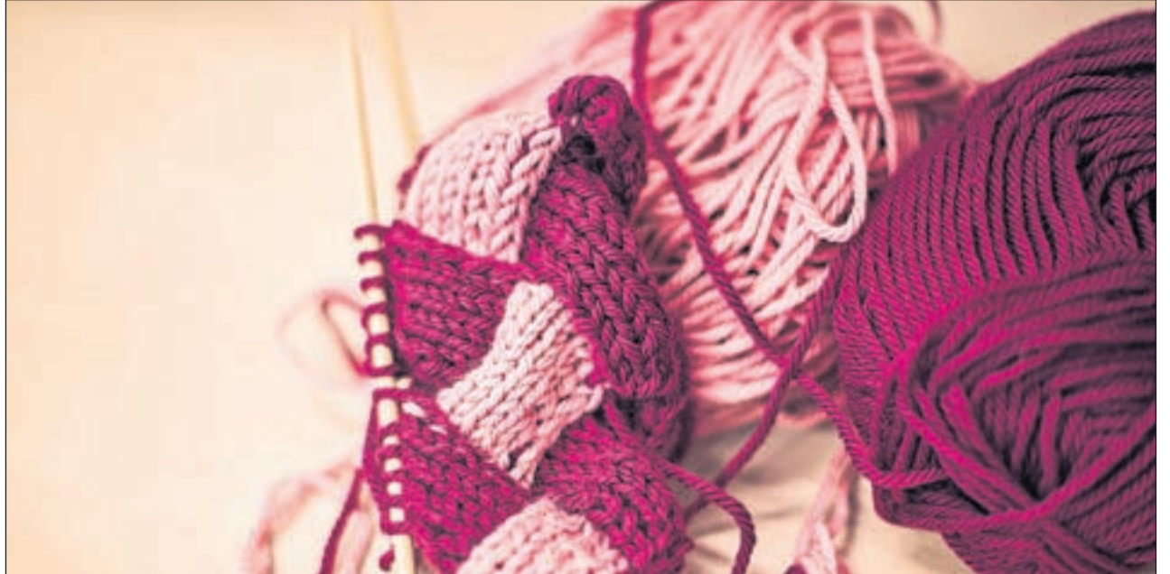
Att sticka och virka blir allt trendigare. Också i år erbjuds kurser i ämnet via medborgarinstitutet

Kursen startar 16.9 kl 14.30 på Vörrå huvudbibliotek. Första delens kursnr 111701. Andra delens kursnr 111702 och tredje delens kursnr 111703. Man kan delta i alla eller i någon del enligt önskemål.